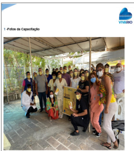
1 - Fotos da Capacitação